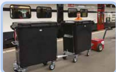
Клининговые компании и уборка