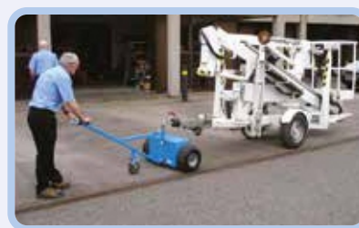
промышленность и производство