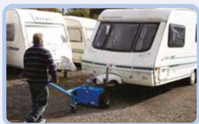
перемещение прицепов и трейлеров