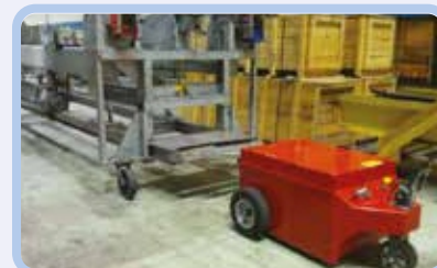
логистика и склад